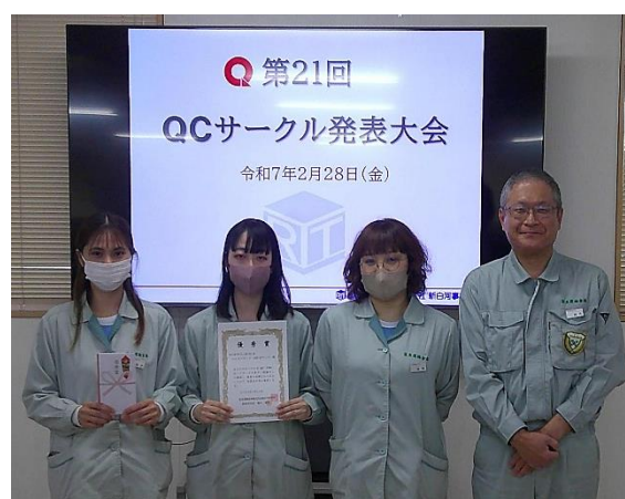
優秀賞 エビカツサンド(AB活サンド)