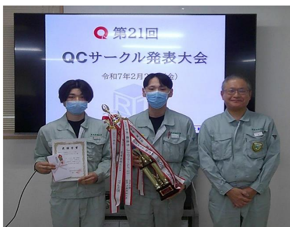
最優秀賞 MB戦隊だるまブラザーズ